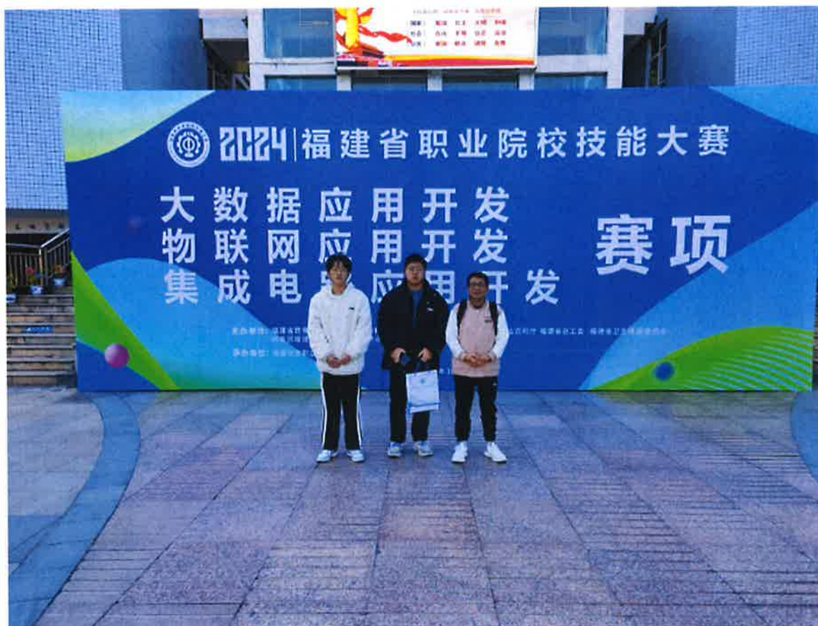
数据产业学院喜获“大数据应用开发”赛项一等奖