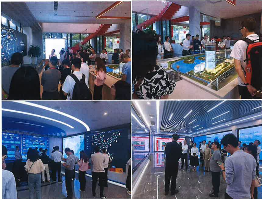
图 2 大数据集团展厅现场

为响应中共中央、国务院《关于构建数据基础制度更好发挥数据要素作用的意见》文件精神，进一步加快数据资源开放共享、应用开发、流通交易，释放数据要素潜能，福建省大数据集团以“服务数字福建建设，推动数字经济发展”为宗旨，面向全国举办数据应用开发大赛，计划征集并形成一批优秀数据应用作品，促进数据共享流通与开发利用，更好推动数字经济高质量发展。