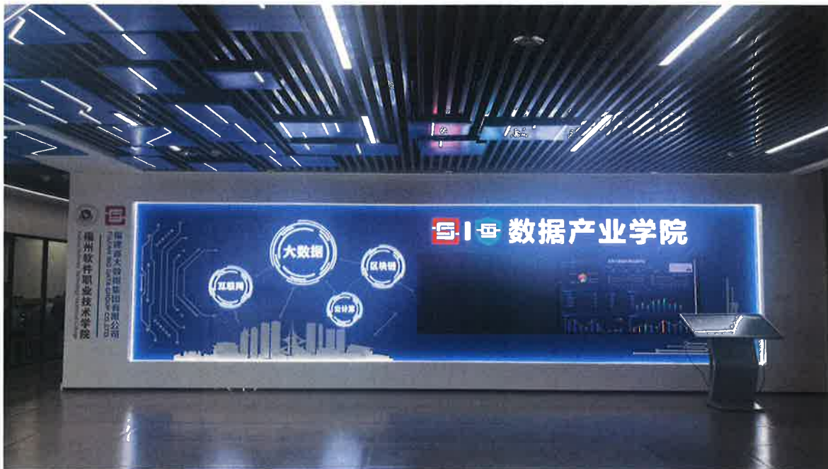
数据产业学院展示墙