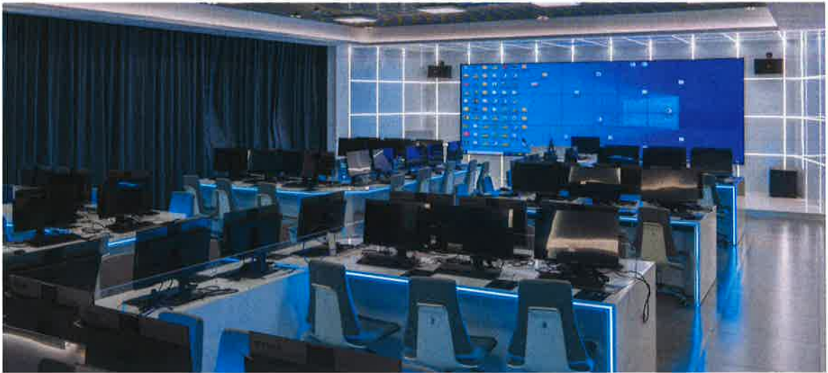
数据产业学院二期区块链实训室

此外，数据产业学院投入数据技术虚拟实训基地软件平台。平台是由大数据集团与校方共同搭建了多样化的数据处理和分析、云计算、区块链软件平台，涵盖数据库管理、数据挖掘、数据可视化、云计算、区块链等领域。学生可以在虚拟环境中学习和实践各种数据技术工具和技能。