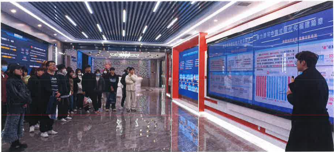
图 7 数据产业学院师生参观大数据集团数字政府展厅