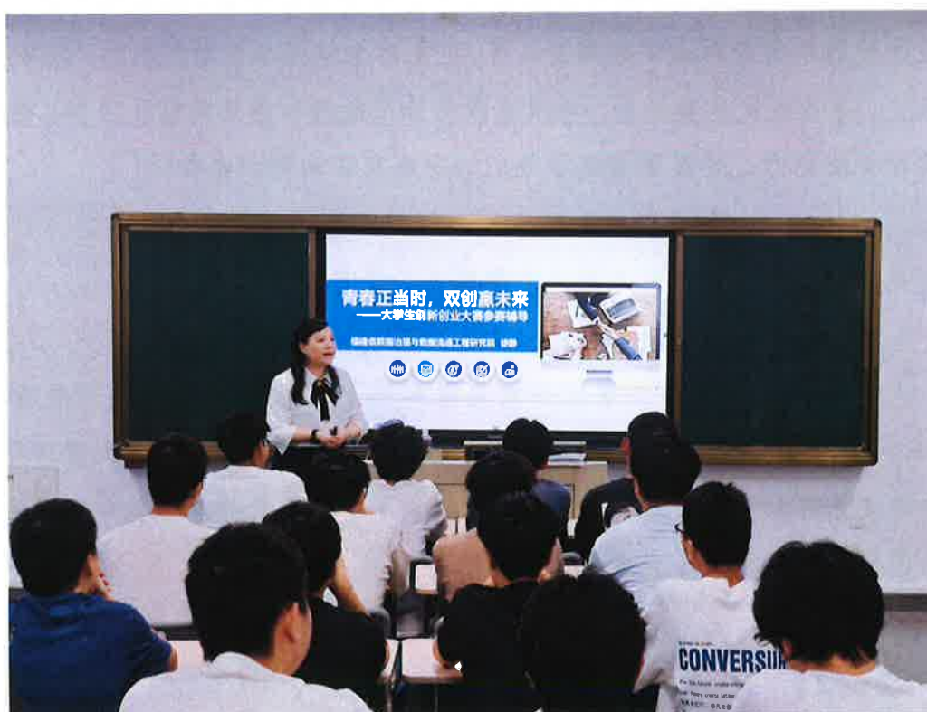
图4 “青春正当时，双创赢未来”创新创业大赛辅导讲座