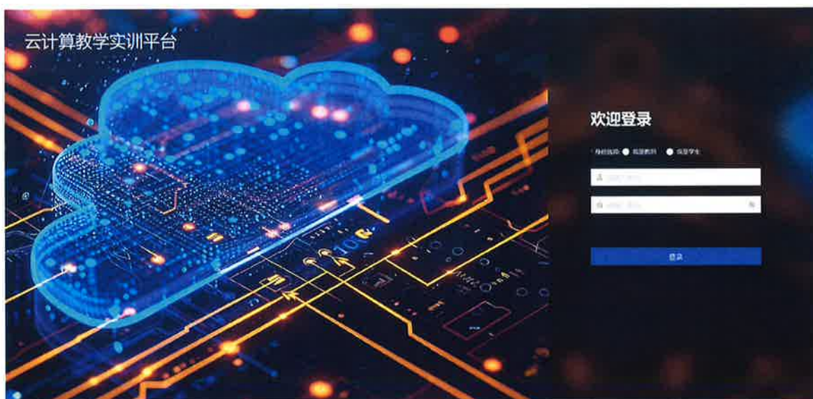
云计算虚拟仿真实训平台

云计算虚拟仿真实训平台,采用虚拟仿真的技术最大程度的还原了企业真实应用现状,保障了实验效果。包括开源 OpenStack 架构、关键组件的工作原理及调用关系;开源 OpenStack 计算、存储、网络等基础 IaaS 层服务的原理及使用;开源 OpenStack 运营、运维理念,开源 OpenStack 运营、运维管理方法等知识点,使学生能够掌握开源 OpenStack 通用知识,具备开源 OpenStack 运营运维能力和实践的能力