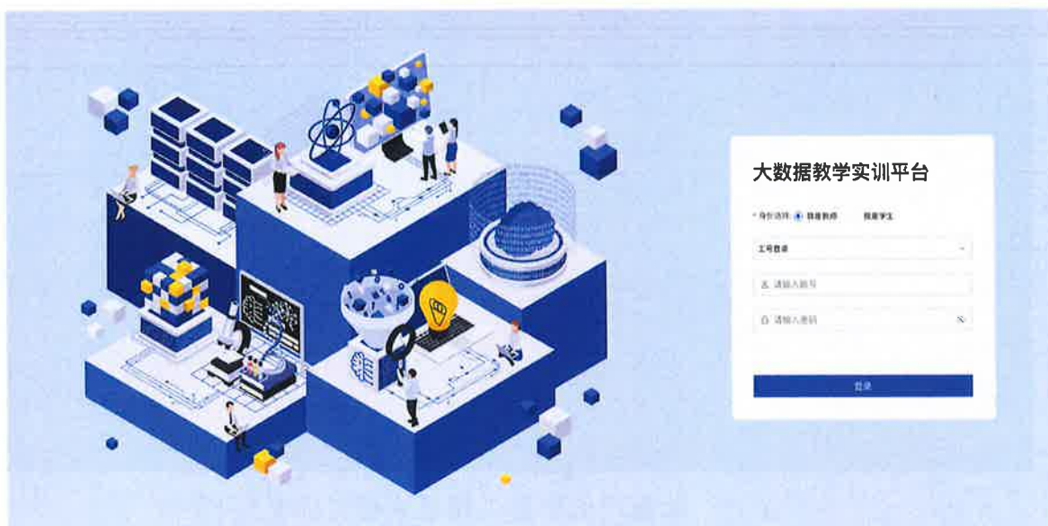
大数据虚拟仿真实训平台

云计算虚拟仿真实训平台,采用虚拟仿真的技术最大程度的还原了企业真实应用现状,保障了实验效果。包括开源 OpenStack 架构、关键组件的工作原理及调用关系;开源 OpenStack 计算、存储、网络等基础 IaaS 层服务的原理及使用;开源 OpenStack 运营、运维理念,开源 OpenStack 运营、运维管理方法等知识点,使学生能够掌握开源 OpenStack 通用知识,具备开源 OpenStack 运营运维能力和实践的能力