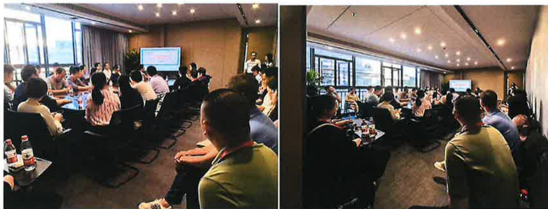
图 1 培训现场

福建省数据治理与数据流通工程研究院有限公司和中国海峡人才市场(福建省人才培训测评中心)联合组织实施了“区块链技术在金融行业的发展与应用”高级研修班，培训效果很好，获得参训人员好评。