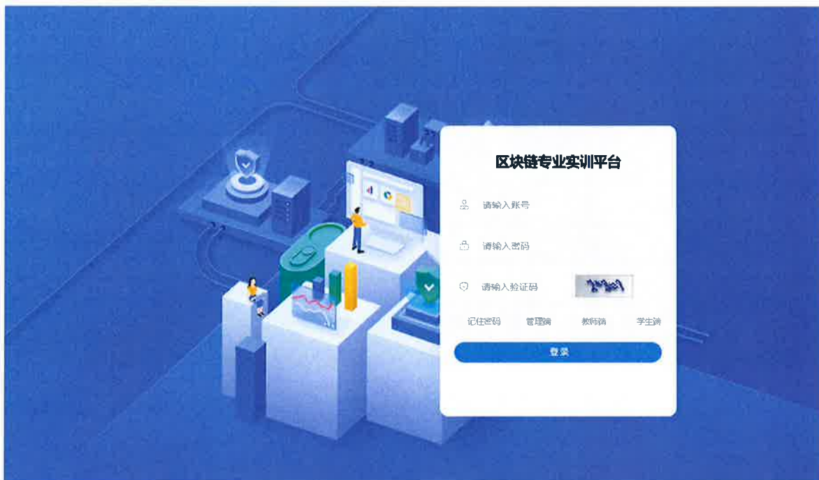
区块链虚拟仿真实训平台

区块链虚拟仿真实训平台，提供用户管理、实验管理、案例管理、课程管理、实训管理、成绩管理、班级管理、上机实训等丰富的功能。平台包含详细的实验指南、对应的操作系统和软件、配套的代码或数据等，这些素材都集成到虚拟仿真实验环境中。根据不同的实验目的，事先创建了几十个容器镜像，并内置于资源调度系统中，供区块链实验云平台系统调用。这些镜像包含大量实验工具，比如：Eclipse、MySQL、GO 语言编译器与开发环境、Geth、Solidity 编译器、MetaMask、Hyperledger Fabric、Truffle、JDK、Node.js、PyCharm 等。