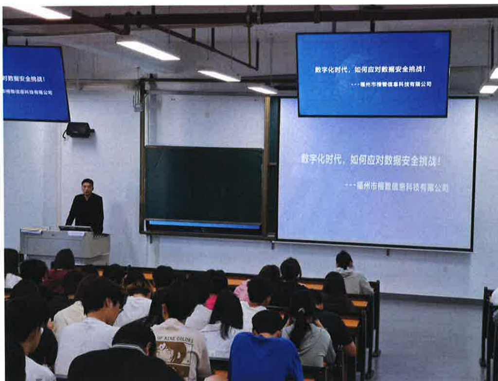
图3 “一技在手，一生无忧”数据安全讲座