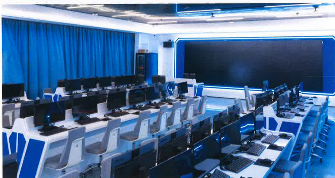
数据产业学院二期云计算实训室