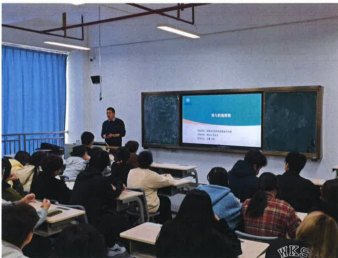
图 5 数据要素系列讲座