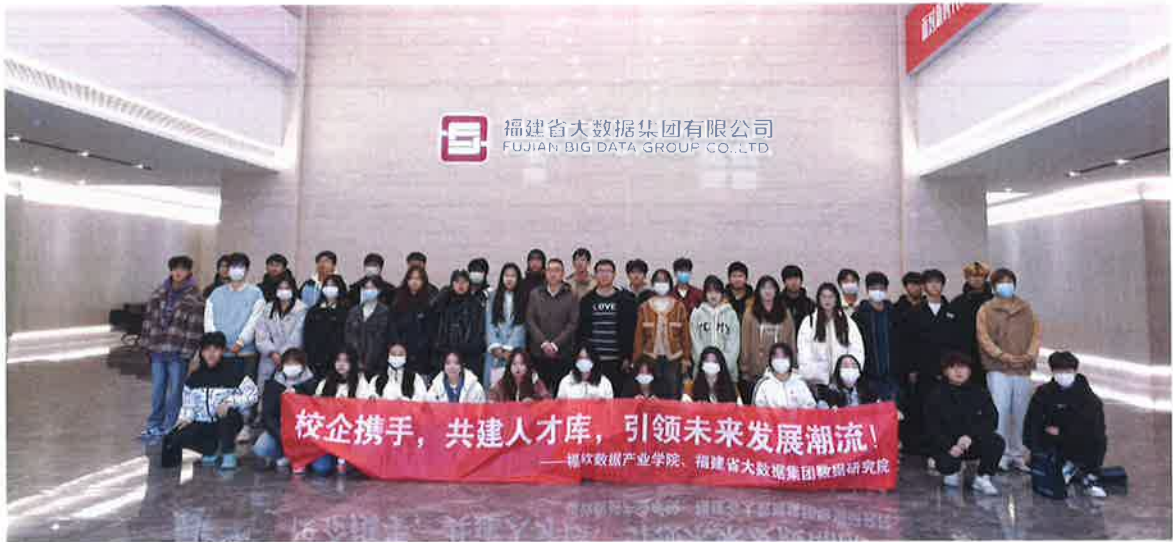
图 6 数据产业学院师生在大数据集团大厅合影