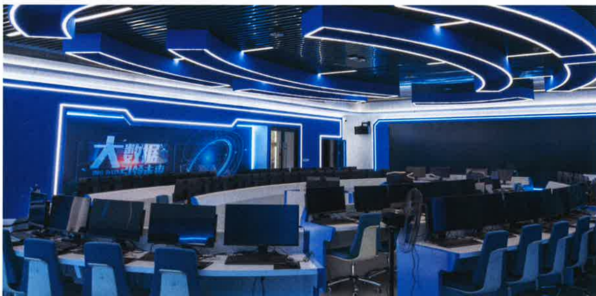
数据产业学院一期大数据实训室